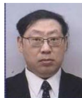
埼玉県医療機器工業会 会長