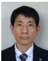
埼玉県保健医療部 薬事課長