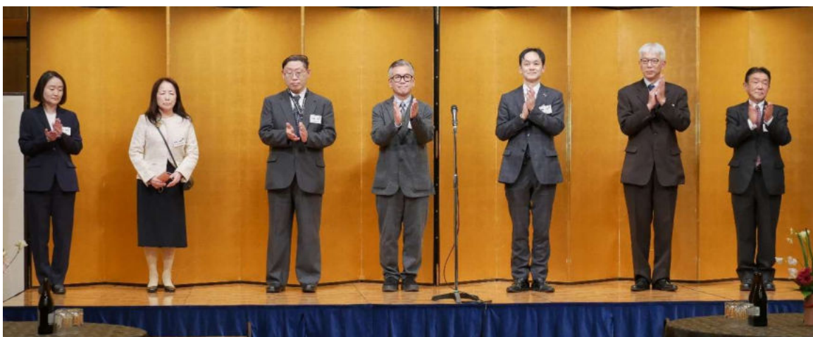
埼玉県薬事団体連合会の所属団体代表