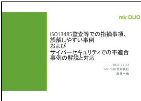
mkDUO 合同会社 肘井 代表